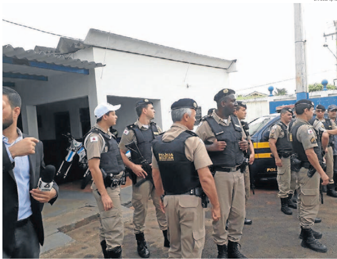
CONCENTRAÇÃO. Policiais de Minas Gerais reunidos antes do início das ações operacionais

a partir das cinco horas da manhã, cumprindo mandados de prisão e busca e apreensão, bem como capturas de foragidos, abordagens de suspeitos, fiscalização nas estradas e ações sociais, como panfletagens e trabalhos de conscientização, cada grupo