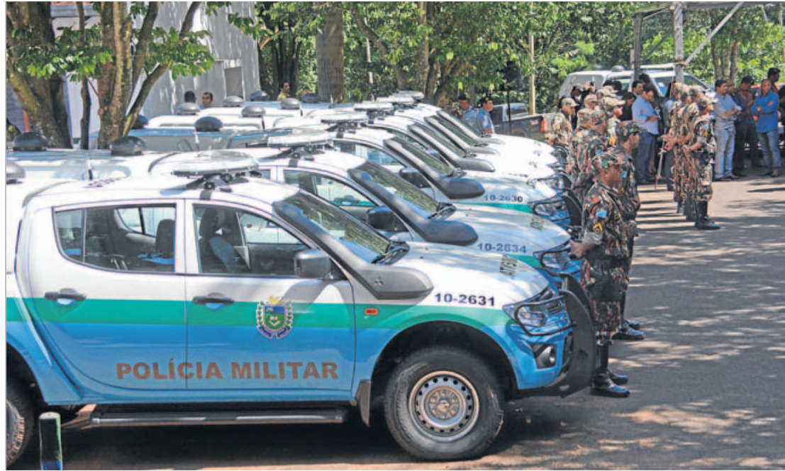
REQUIPAMENTO. A PMA recebeu um novo lote de viaturas para ampliação do trabalho no Estado

Dentro deste aspecto, afirma o coronel Jefferson Vila Maior, comandante do 15º Batalhão da PMA, as camionetes serão empregadas em operações volante nas rodovias, ampliando a capacidade de mobilidade das equipes. O trabalho, acredita, trará resultados positivos ao estado pois, além de aumentar a arrecada-