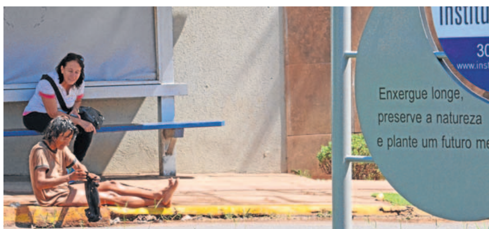
LIMPEZA. Moradora de rua aproveitou para “lavar” a roupa em água de chuva depositada em um pequeno buraco na rua, junto ao meio-fio.