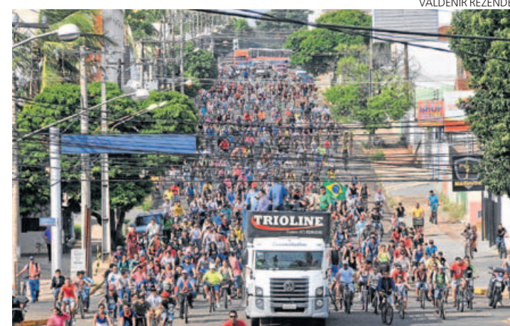
PASSEIO. Ciclistas mantiveram a tradição no Dia do Trabalhador